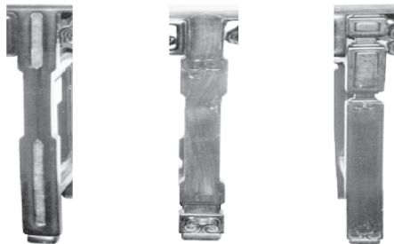
图6 琴桌的腿部与脚部装饰

宋明时期大部分琴桌呈现出的样式类似于宋代画家佚名所绘制的《会昌九老图》中的形状，即采用单层厚实的桌面设计。清华大学艺术博物馆的珍藏品是一张黄花梨木制的四面平内翻马蹄琴桌，长143.6厘米，宽42厘米，高79.2厘米。图2所示的这张桌子四周都是平整的，桌面的边缘由很多木板拼接而成，桌子的内部只有一块独立的木板作为支撑，这块木板的下面用支架固定在左侧的透榫上，然后用与木纹一致的板条封住，桌子的腿很有特色，上宽下窄，腿部上端和两侧的牙板都做了很别致的造型，腿部和牙板的内角都是弧形的，脚底下是内翻的马蹄形状。这个事情曾经被杨耀研究过，并被记载在古斯塔夫·艾克的《中国花梨家具图考》中。杨耀在他的《明式家具研究》中也收录了两件琴桌，与此类似。伍嘉恩珍藏的黄花梨四面平琴桌，尺寸为长114.2厘米、宽45.2厘米、高85.8厘米。它没有束缚的束腰，没有斜着的枨，也没有突出的角牙，这让它的骨相更加清晰独特，简约而不平凡。