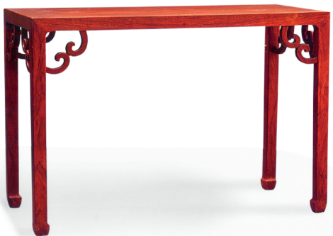
图1 明 黄花梨两卷角牙琴桌 陈梦家夫人旧藏