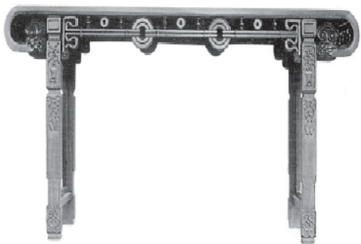
图 3 清代 红木恭壁纹圆头琴桌

中国艺术通过多种方式来表现“间空”。比如在《论间空》中提及的“一张简朴的明代琴桌”，它的全身是素的，只有几个略带文饰的牙，这种简洁的设计反映了空间的清晰和简明。另外，中国画中的“虚实相生”也是一种表现“间空”的方式，通过巧妙地运用空白和线条来表达空间的存在和变化。总之，中国艺术以不同的方式来表达“间空”，这些方式既有明确的形式，也有隐晦的意象，但它们都是中国艺术独特的表现方式，反映了中国文化的深厚底蕴。